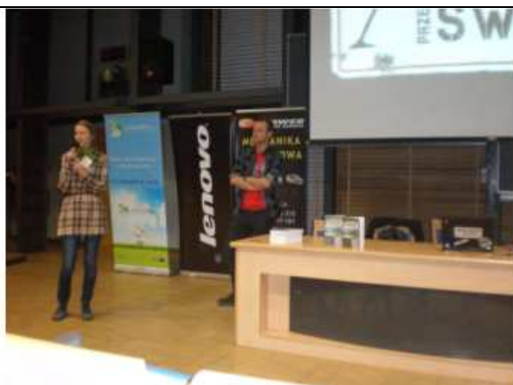
Wykład na Uniwersytecie Warszawskim