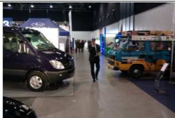
Na Targach Fleet Market w Warszawie