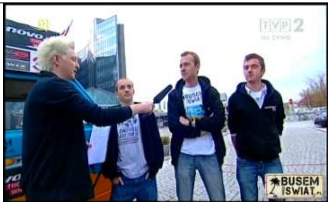
W Poziomie 2.0 TVP2