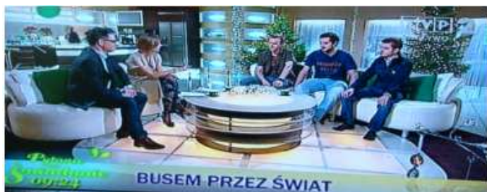
W Pytaniu na Śniadanie TVP2