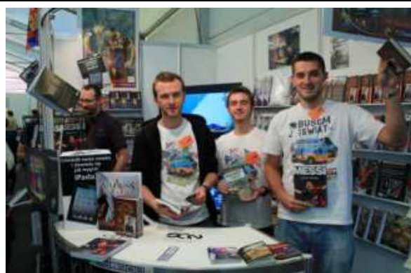
Na Targach Książki w Krakowie