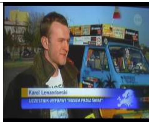
W Faktach TVN