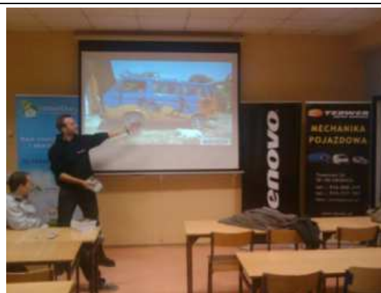
Na Wyższej Szkole Bankowej we Wrocławiu