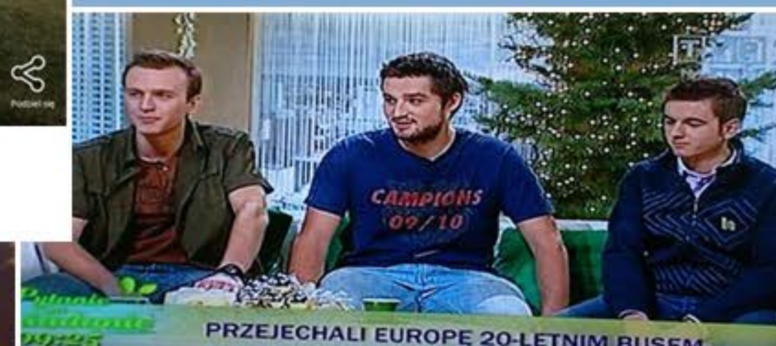
W programie „Pytanie na Śniadanie”