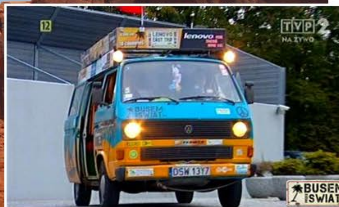
Na żywo w TVP2