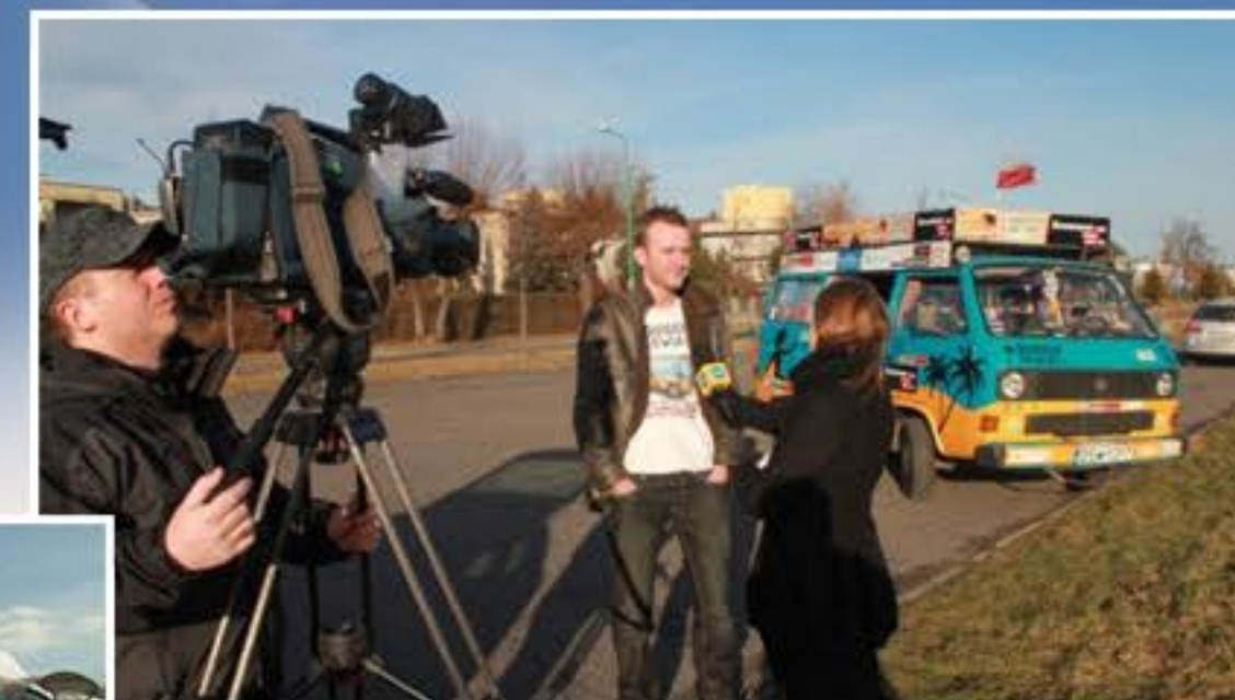
Wywiad dla TVN24